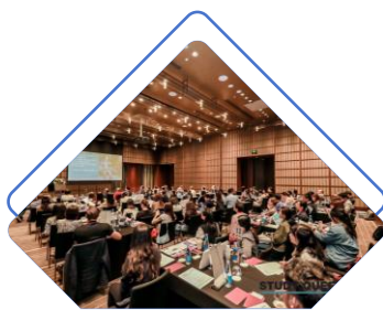
上海昆士兰教育推介会